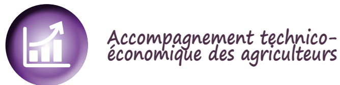
Illustration en quelques actions

Accompagnement technico-économique des agriculteurs