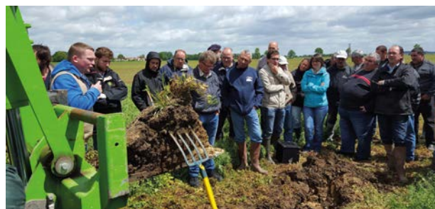
Présentation profil de sol sous pois d'hiver

En collaboration avec Lemken, Claas et les Aliments Chouvy