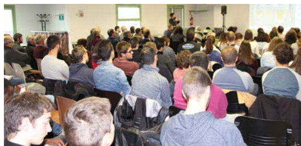
Salle comble pour cette restitution.

Les rendus (fiches pratiques et films seront disponibles dès le printemps 2018 sur le site de la Chambre d'agriculture du Puy-de-Dôme.