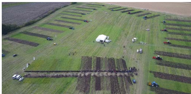
Vue d'ensemble de la parcelle

*Journée en partenariat également avec : Quivogne, Lachaud, Bechamatic Lafforgue, Alpego, Actisol, Horsch, Carré, Amazone, Sly, Duissard, Ital'Agri, Lemken, He-va, AgriDis, Bourbonnais Fraisse, Bugnot, Köckerling, Duro-France et Ovlac.