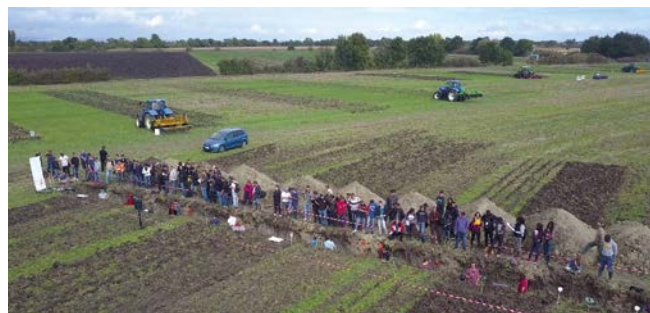
Présentation des profils de sol