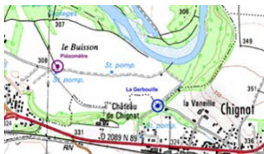
Sur le piézomètre de Pont-du-Château