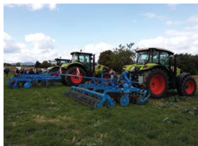
Héliodor 9, Rubin 9 et Karat 9 sur chaumes de céréales

Une vingtaine d'agriculteurs le matin, et une dizaine l'après-midi accompagnés par les lycées du Puy-de-Dôme ont répondu présent sur cette journée. Remerciements bien évidemment à tous nos partenaires et à l'EARL des Dômes.