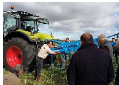
Présentation du déchaumeur à dents Karat 9 sur repousses de colza

En collaboration avec VetAgro Sup, lycée agricole du Breuil/ Couze et Caussade semences