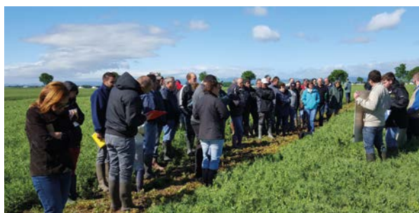
Présentation de la culture du pois d'hiver

Un apéritif déjeunatoire servi sur la parcelle a conclu la matinée.