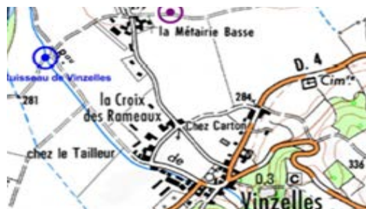
Sur le piézomètre de Vinzelles

Norme de potabilité : 0.1 µg/l pour 1 molécule et 0.5 µg/l en cumulé.