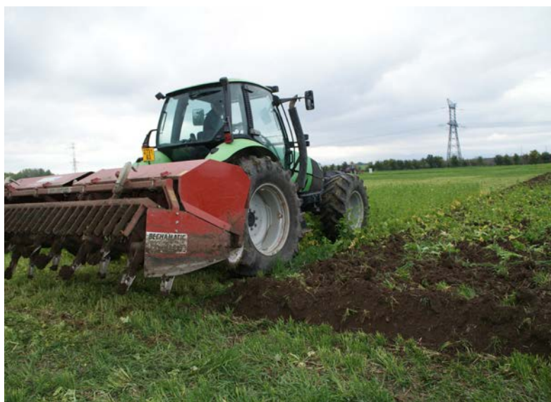
Machine à bêcher pour une destruction et un enfouissement en profondeur

Les outils d'enfouissement en profondeur parmi lesquels nous trouvons les machines à bêcher et les charrues permettent de détruire et d'enfouir les couverts en profondeur.