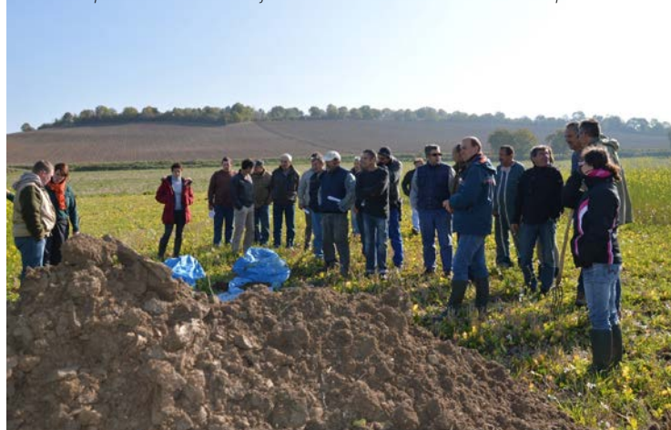
Visite du profil de sol : il est toujours intéressant d'observer son sol de près.

des galeries, d'où l'intérêt de laisser mon couvert en surface.