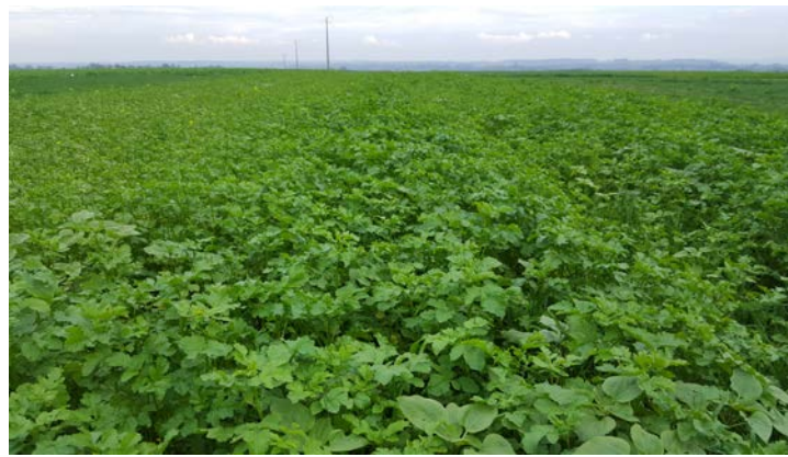
Couvert Avoine Rude + Tournesol + Phacélie + Radis Chinois + Moutarde Blanche + Vesce de Bengale à 23kg/ha