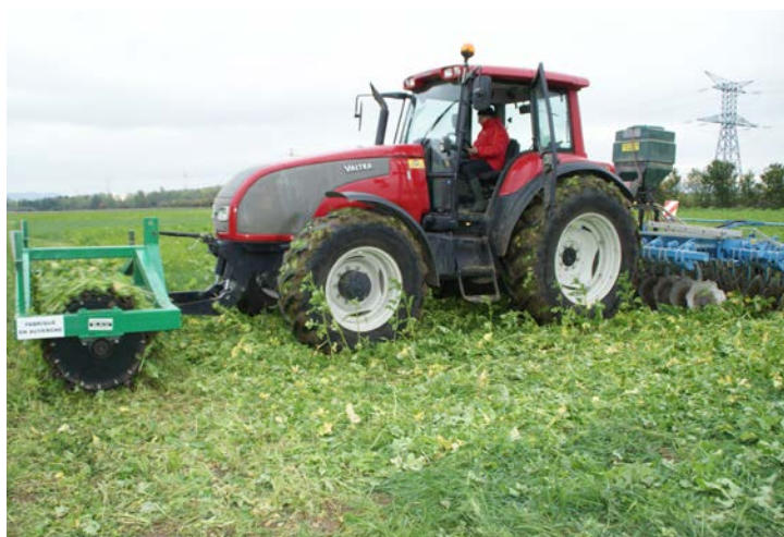
Rouleau de destruction en action sur couvert développé

(Retour sur la journée du 15/10 chez Dominique Deplat à Joze)