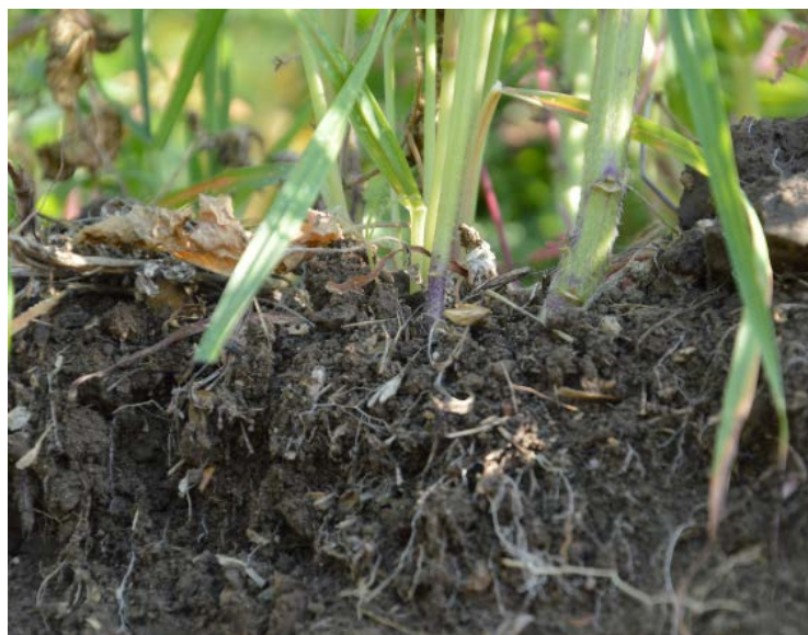
Horizon superficiel sous couvert intermédiaire - Chalus 2015