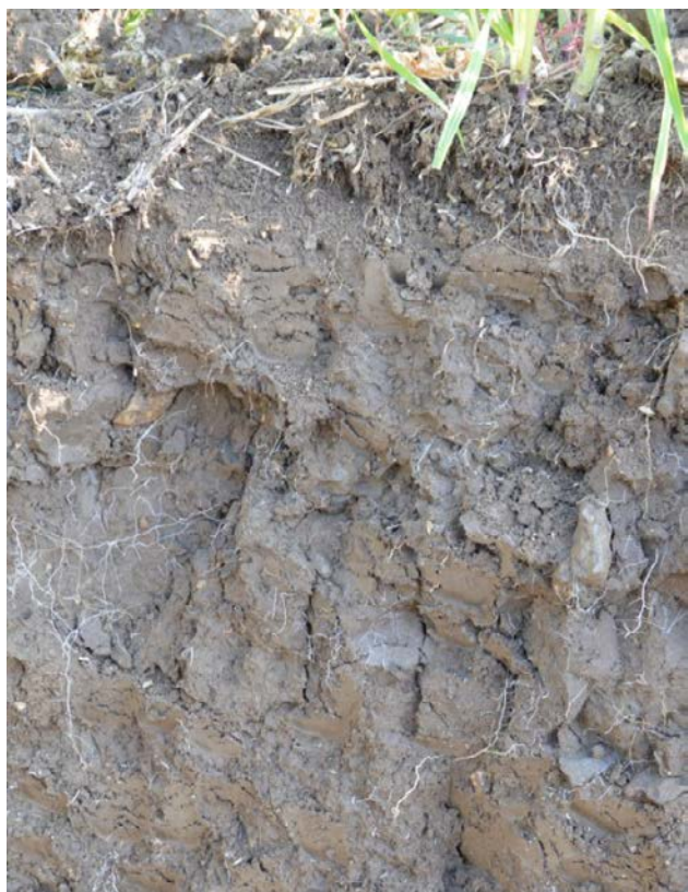
Profil du sol sous CIPAN - Chalus - octobre 2015

En surface, au contraire, la structure est bien adaptée car protégée par la végétation jusqu'à la destruction du couvert. Cette végétation laissée en surface va créer un « mulch », qui, tout l'hiver, va protéger votre sol de l'érosion tout en préservant sa structure de surface.