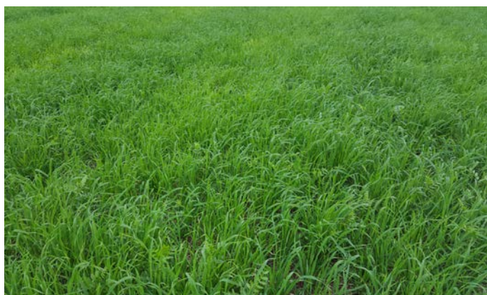
Couvert Avoine Rude + Vesce Commune à 35kg/ha

Attention l'avoine rude, appelée aussi avoine brésilienne, est une céréale qui talle fortement en été : la densité de semis préconisée peut être fortement réduite par rapport à l'avoine de printemps classique, semée quant à elle de 60 à 80 kg/ha en pur.