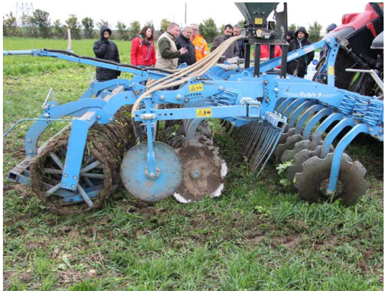
Déchaumeur à disques indépendants pour détruire et enfouir superficiellement

Les outils à disques sont généralement présents sur les exploitations du département contrairement aux outils à dents. Cependant, ils peuvent augmenter le risque de multiplication des vivaces (liserons notamment) alors que les outils à dents arrachent mais ne les tranchent pas. Le type et la profondeur du sol sont également décisifs.